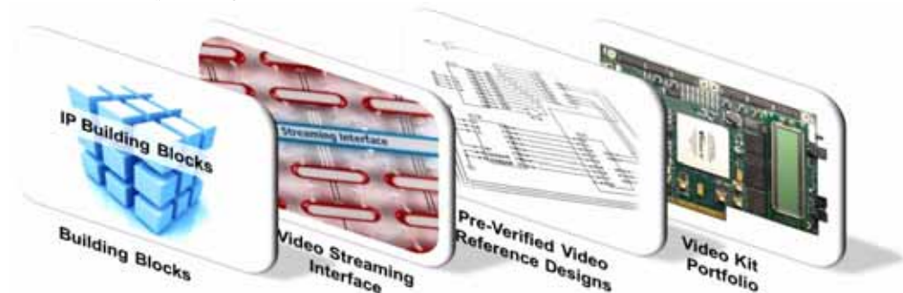
图 2. Altera 的视频设计工作台

采用 Altera 的视频设计工作台，设计人员开始已有的工作设计，在常见功能上重新使用经过预验证的 IP，例如，缩放、去隔行和合成，加入到定制功能中，与从头开发新设计相比，在更短的时间内完成设计。