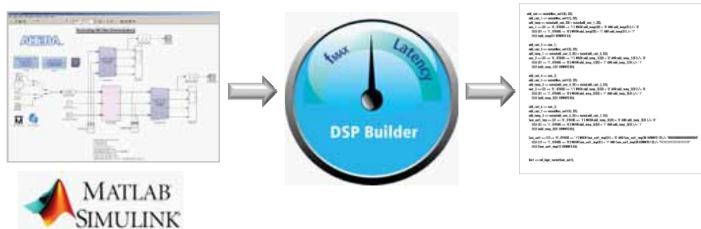
图 1. DSP Builder 高级模块集